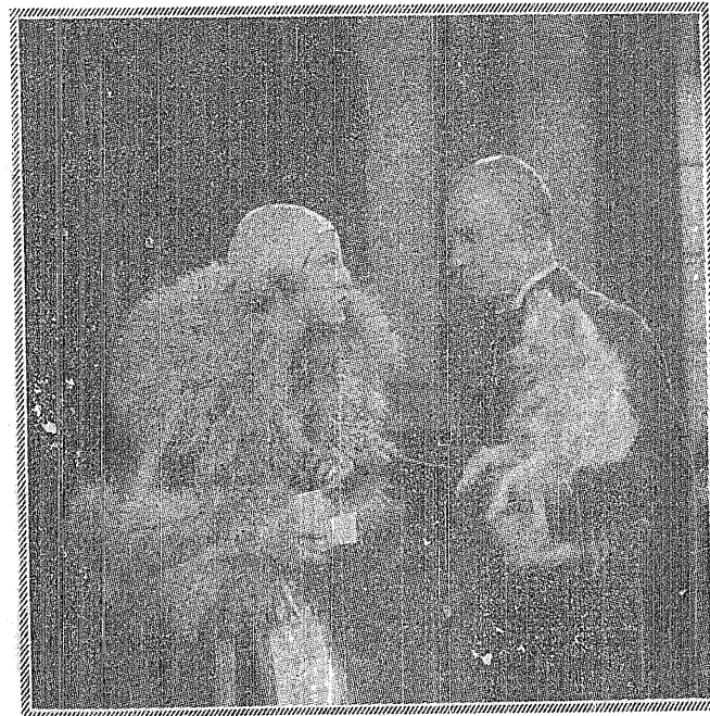
BRIGITTE HELM und ALFRED ABEL

Es ist bereits im Inhalt kinomäßig ausgezeichnet. Es handelt